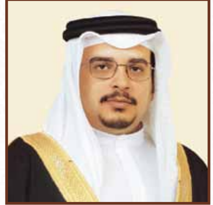
صاحب السمو الملكي الأمير سلمان بن حمد آل خليفة ولي العهد نائب القائد الأعلى النائب الأول لرئيس مجلس الوزراء