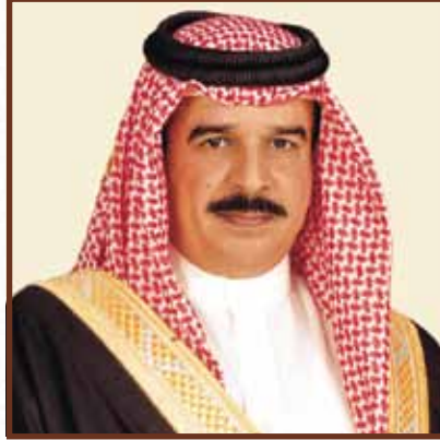
حضرة صاحب الجلالة الملك حمد بن عيسى آل خليفة ملك مملكة البحرين المفدى