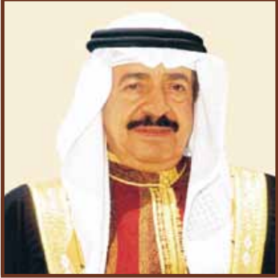
صاحب السمو الملكي الأمير خليفة بن سلمان آل خليفة رئيس الوزراء الموقر